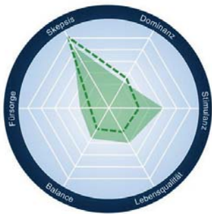
Abb. 1: EMOTIONALES PROFIL BEIM LAUNCH UND BEIM NEGATIV VERLAUFENEN LAUNCH