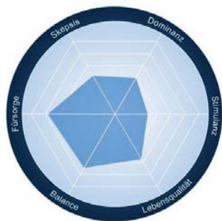
Abb 4. EMOTIONALES PROFIL BEI PATENT-ABLAUF