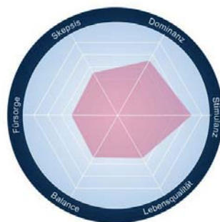
Abb. 2 und 3: EMOTIONALES PROFIL IN DER WACHSTUMS- UND IN DER REIFE-PHASE

Ein Produkt in der Phase der Marktreife zeichnet sich durch eine deutlich reduzierte Skepsis und Stimulanz aus. Häufig werden auch Elemente der Dimension Dominanz